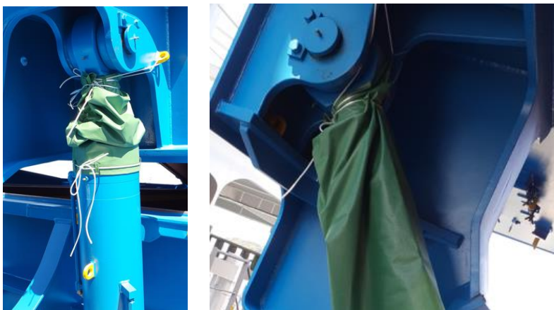
Photo 1) Protective cover of the hydraulic cylinder for end-folding hatch cover

If you provide us with drawings of hydraulic cylinders, we can design and manufacture it complying to the order for each type. This product is at a lower price as compared with the bellows type cover, whose news were uploaded as “HATCH COVER NEWS #6” (Refer to this link ).