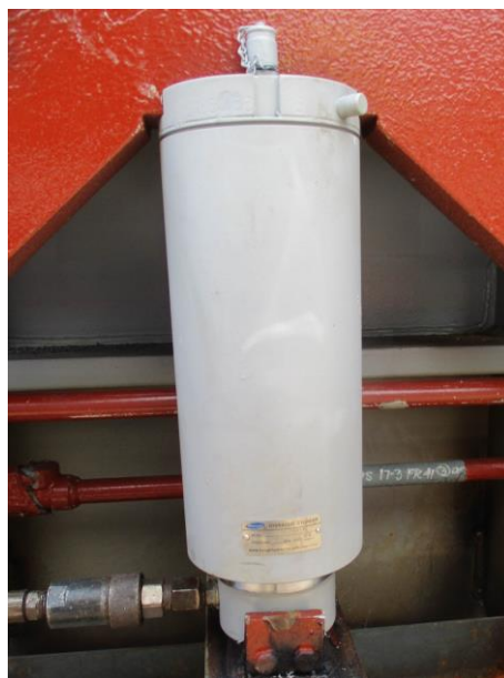
写真 2) 新製品

以上、お客様にはご迷惑をおかけしますが、何卒ご理解賜りますようお願い申し上げます。