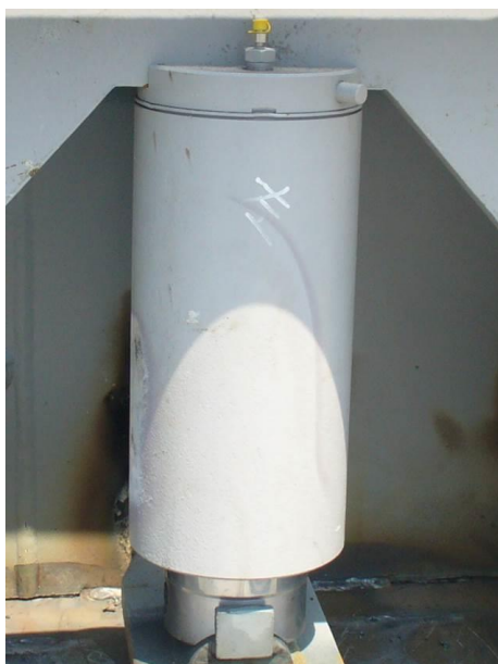
写真 1) 旧製品